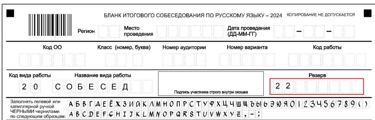
Рисунок 2. Заполнение поля «Резерв» для участников с ОВЗ